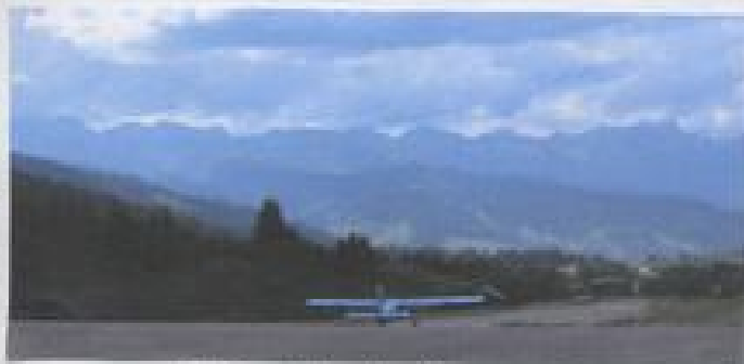
L'altipant de Hajaica

Wass pique. ripure à la cote 2000 sur des champs de fleurs au pied du mont d'été