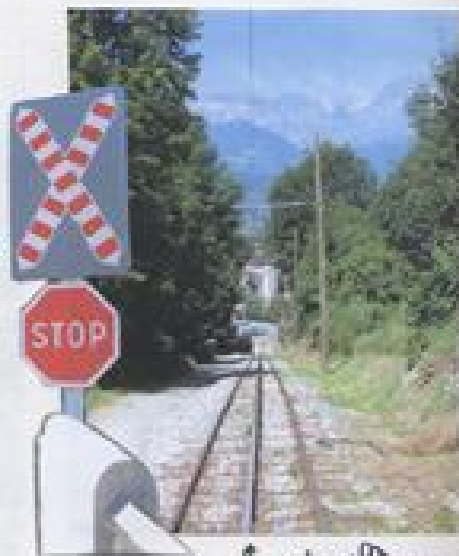
Le col médian

En sortant de ma case j'ai traversé la voie ferrée qui inspire le hameau pour monter au col d'Égley.